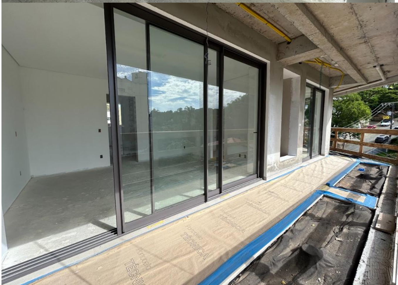
2.3 Teste de estanqueidade da manta asfáltica no 12º pavimento