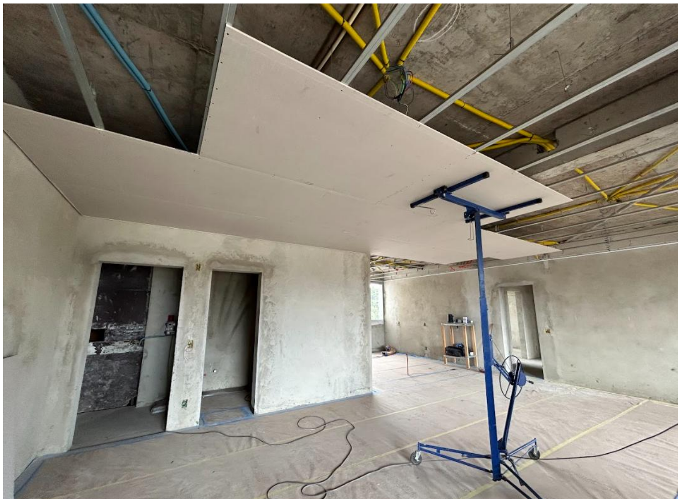
2.6 Aplicação da pastilha da piscina 9º pavimento em andamento