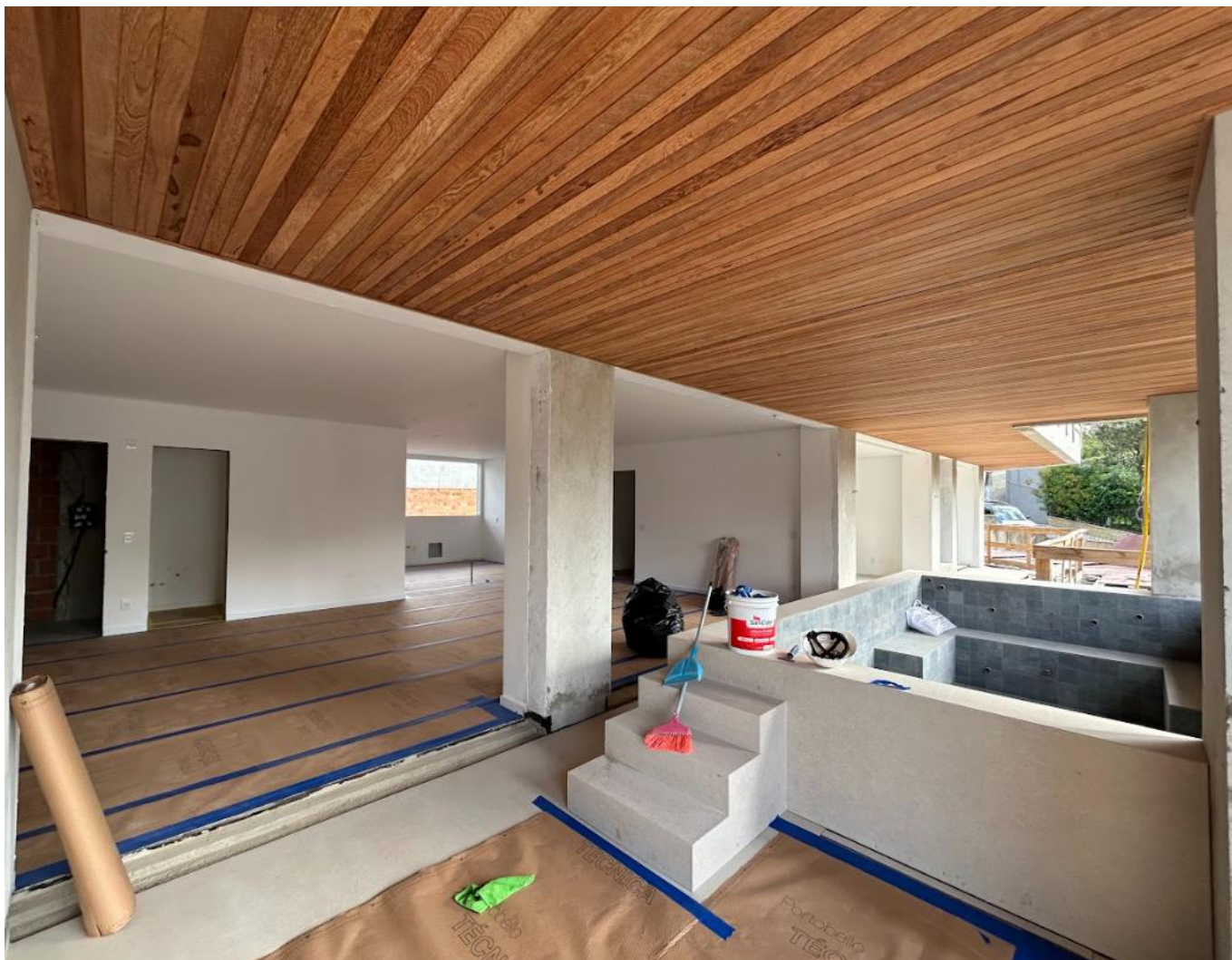
2.2 Esquadria porta-janela instaladas