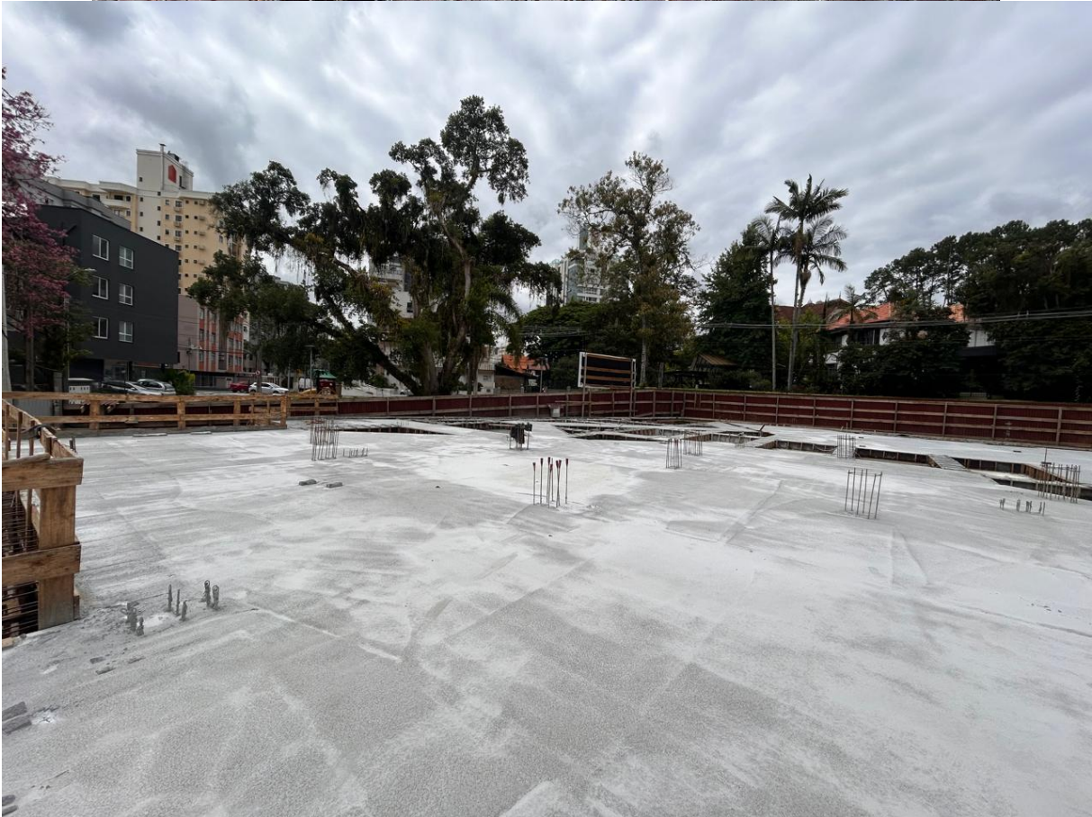
2.3 Escavação (2ª etapa)