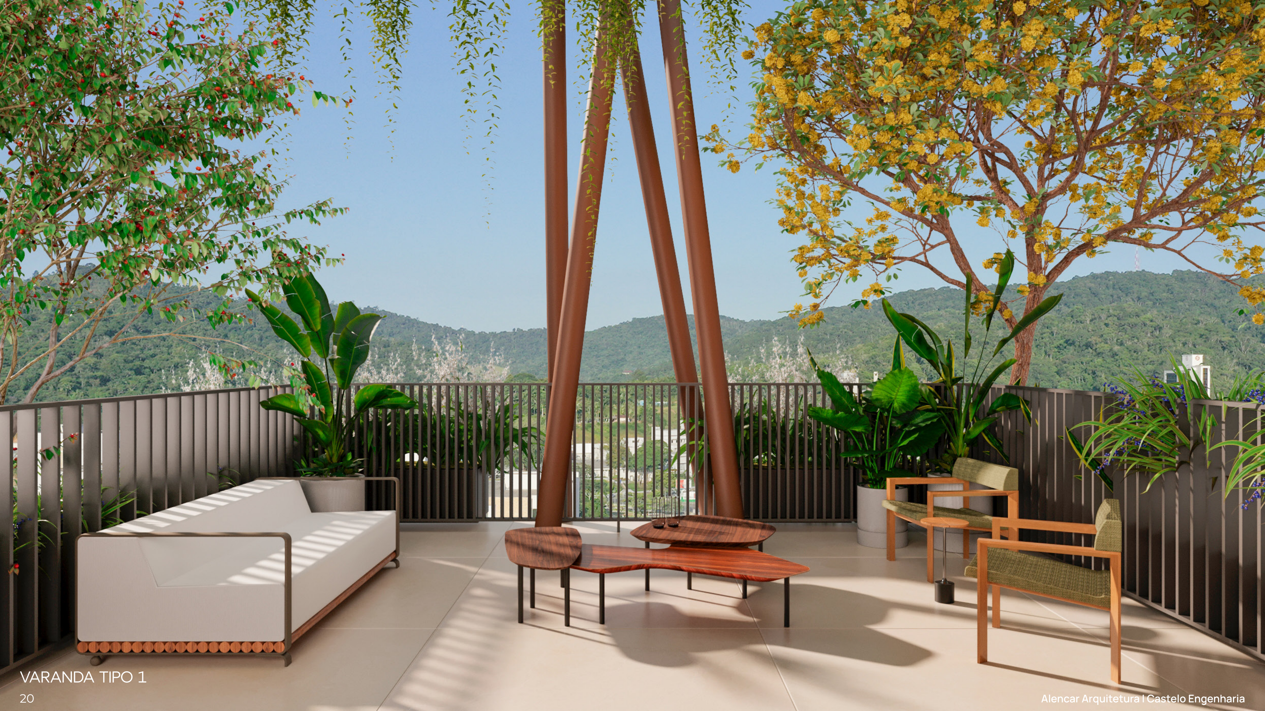
VARANDA TIPO 1