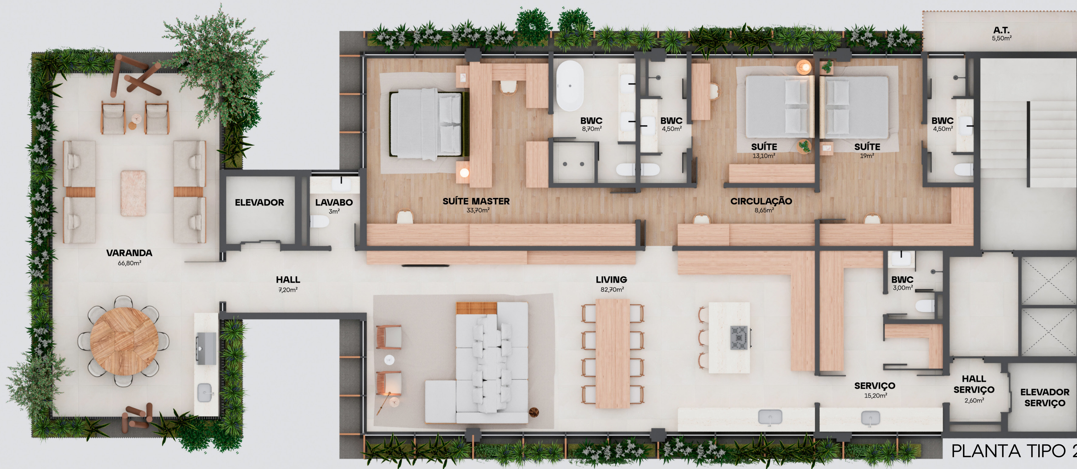
PLANTA TIPO 2