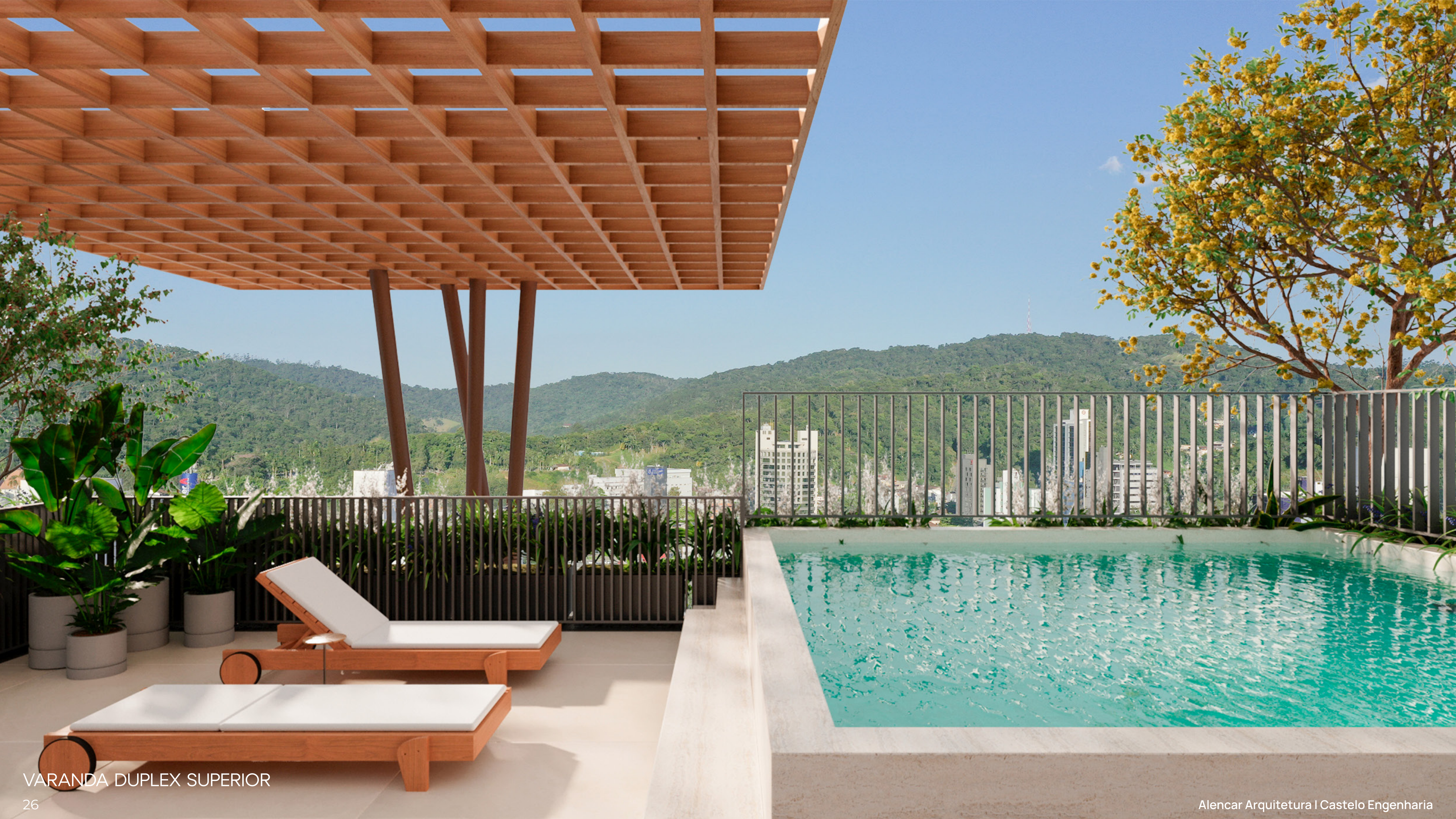
VARANDA DUPLEX SUPERIOR