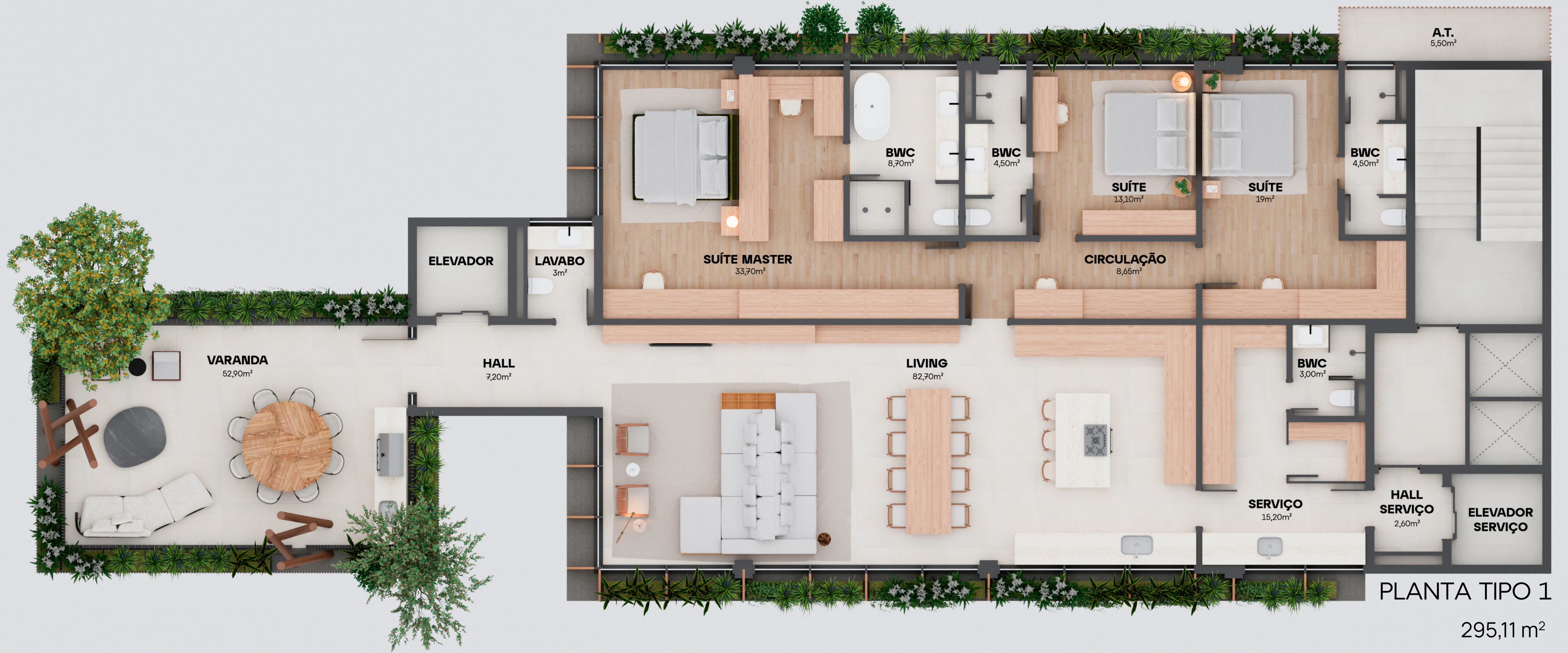
PLANTA TIPO 1 295,11 m 2